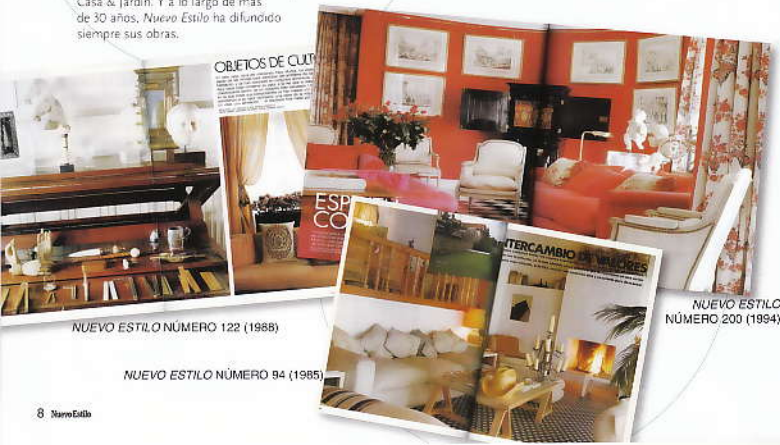
NUEVO ESTILO NÚMERO 122 (1988)

mo abandonó los estudios de Arquitectura, quiso ser cineasta y acabó de pionero en una profesión que amó con pasión. Y profundamente humano y didáctico. Fue el maestro, directo o indirecto, de las siguientes generaciones de interioristas españoles, esos que, a la altura de reputados nombres internacionales, tienen un alma mediterránea que los hace más cercanos, más nuestros. Y en estas páginas tienen su altavoz y su casa.